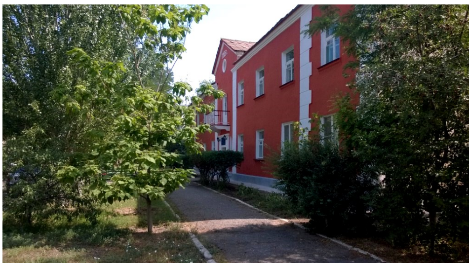
Главный корпус филиала АГУ в г. Знаменске