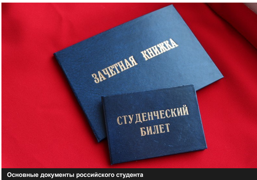
Основные документы российского студента