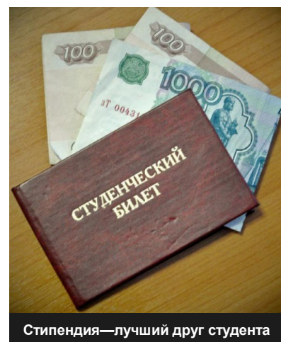
Стипендия—лучший друг студента

Социальная стипендия назначается студентам, обучающимся на бюджетной основе, из семей с трудным материальным положением. Чтобы получить ее, необходимо предоставить справки о составе и доходах семьи в Управление социальной защиты населения по месту жительства, которое выдает СПРАВКУ для начисления социальной стипендии. Ее нужно предоставить в деканат в установленные сроки.