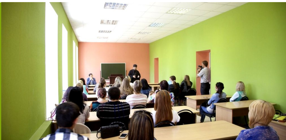
В вузе ведут лекции не только преподаватели, но и приглашенные гости

Зачетная неделя проводится после окончания чтения лекций и выполнения лабораторных и практических работ, до начала экзаменационной сессии. В этот период студент должен ликвидировать все задолженности (контрольные, курсовые работы и др.) и сдать все установленные зачеты.